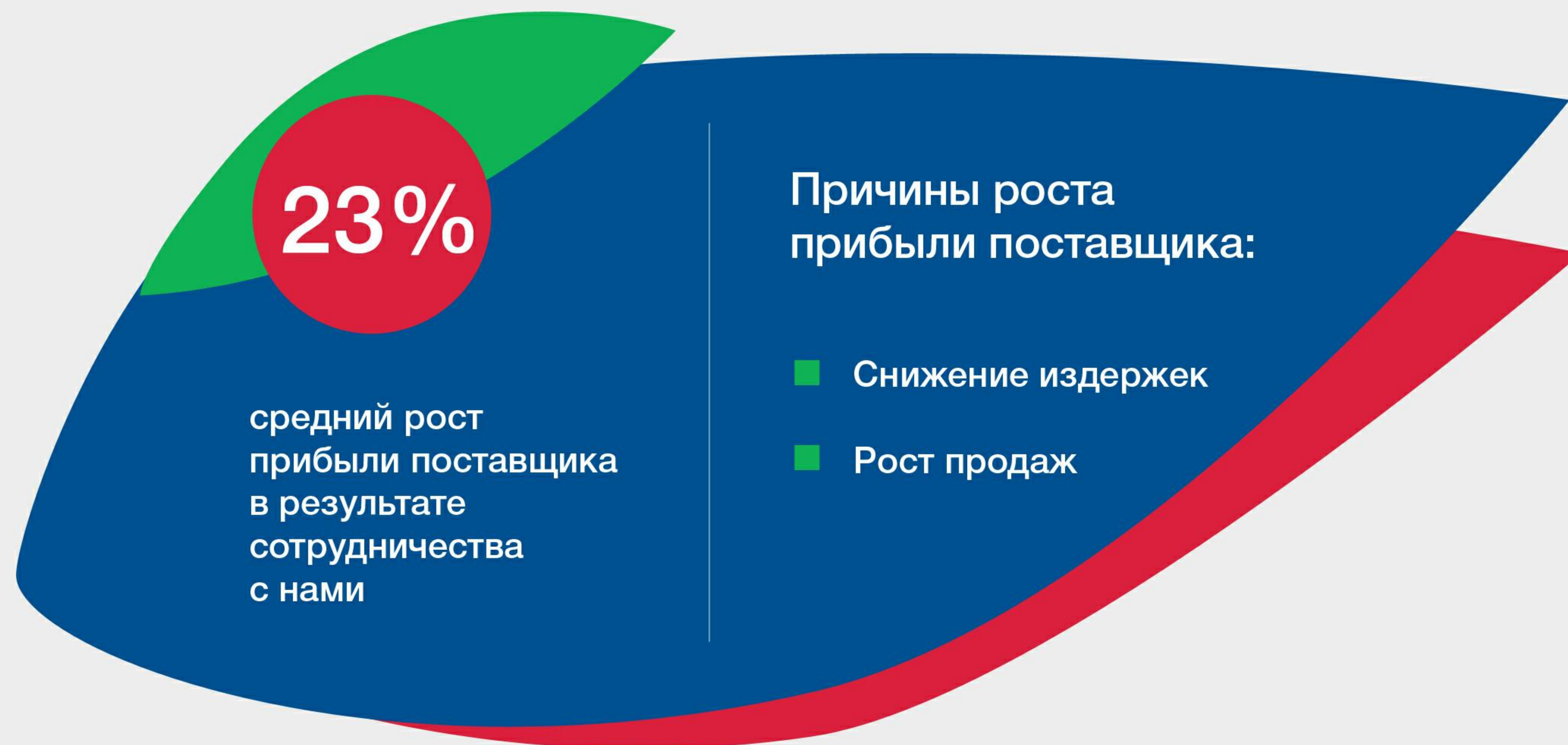
График роста прибыли поставщика

Все это способствует продвижению продукции и увеличению продаж производителя на рынках